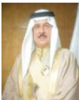
○ جلالة الملك.

تنفيذا للتوجيهات الملكية السامية لحضرة صاحب الجلالة عاهل البلاد العفري بتوحيد الجهود الوطنية على المستوى المحلي لمواجهة انعكاسات انتشار فيروس كورونا كوفيد-١٩ عالمياً بما يحافظ على صحة وسلامة المواطنين والمقيمين بالبلاد، مع استمرار برامج الدولة ومسيره عملها تحقيقاً لمساواة التنمية المستدامة لصالح المواطنين، قرر مجلس الوزراء أن تتكفل الحكومة بدفع ٥٠% من رواتب البحرينيين المؤمن عليهم في القطاع الخاص للقطاعات الأخرى نظراً مدة ثلاثة أشهر بدءاً من أكتوبر ٢٠٢٠، ويستفيد منه ٢٣ ألف عامل بحريني و٤ آلاف منشاء، كما وافق مجلس الوزراء على دفع ٥٠% من رواتب ما مجموعه ٥٢٤ من العمالات في رياض الأطفال ودور الحضانة من غير المؤمن عليهم مدة ٣ أشهر بدءاً من أكتوبر ٢٠٢٠، كما قرر المجلس تمديد دعم الأجور المقدم من صندوق العمل (تمكين) مدة ٣ أشهر إضافية ابتداءً من شهر أكتوبر ٢٠٢٠ وتلك وواقع ٣٠٠ دينار شهوياً لدعم ٩٥٠ من سواق سيارات الأجرة وسواق النقل المشترك والباصات والحافلات ٨٢٩ مدرب سباق من غير المؤمن عليهم، وقر مجلس الوزراء أيضاً إعفاء المنشآت والمرافق السياحية من دفع رسوم السياحة مدة ٣ أشهر إضافية ابتداءً من شهر أكتوبر ٢٠٢٠. جاء ذلك خلال ترؤس صاحب السمو الملكي الأمير سلمان بن حمد آل خليفة ولي العهد نائب القائد الأعلى النائب الأول لرئيس مجلس الوزراء اجتماع مجلس الوزراء أمس. وبناءً على توصية اللجنة التنفيذية وافق مجلس الوزراء على مشروع