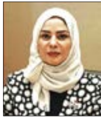
رئيسة مجلس النواب

الوطنية التي تستوجب كل الدعم والمساندة لمواجهة جائحة كورونا.