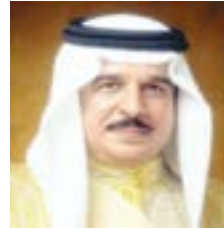
عاهل البلاد المفدى

تنفيذاً للتوجيهات الملكية السامية لحضرة صاحب الجلالة الملك حمد بن عيسى آل خليفة عاهل البلاد المفدى قرر مجلس الوزراء أمس، تكفل الحكومة بدفع 750% من رواتب البحرينيين المؤمن عليهم في القطاع الخاص للقطاعات الأكثر تضرراً لمدة 3 أشهر بدءاً من أكتوبر 2020 وسيستفيد منه 23 ألف عامل بحريني و4 آلاف منشأة.