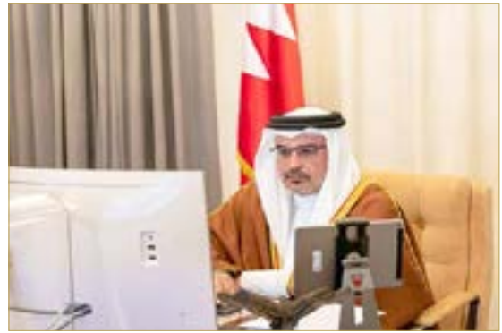
سمو ولي العهد يترأس جلسة مجلس الوزراء

تنفيذاً للتوجيهات الملكية السامية لعاهل البلاد صاحب الجلالة الملك حمد بن عيسى آل خليفة بتوحيد الجهود الوطنية على المستوى المحلي لمواجهة انعكاسات انتشار فيروس كورونا كوفيد - 19 عالمياً بما يحافظ على صحة وسلامة المواطنين والمقيمين بالتوازي مع استمرار برامج الدولة ومسيرة عملها تحقيقاً لمساعي التنمية المستدامة لصالح المواطنين، قرر مجلس الوزراء أن تتكفل الحكومة بدفع 50% من رواتب البحرينيين المؤمن عليهم في القطاع الخاص للقطاعات الأكثر تضرراً لمدة 3 أشهر بدءاً من أكتوبر 2020، وسيستفيد منه 23 ألف عامل بحريني و4 آلاف منشأة. ورأس ولي العهد نائب القائد الأعلى النائب الأول لرئيس مجلس الوزراء صاحب السمو الملكي الأمير سلمان بن حمد آل خليفة، الاجتماع الاعتيادي الأسبوعي لمجلس الوزراء.