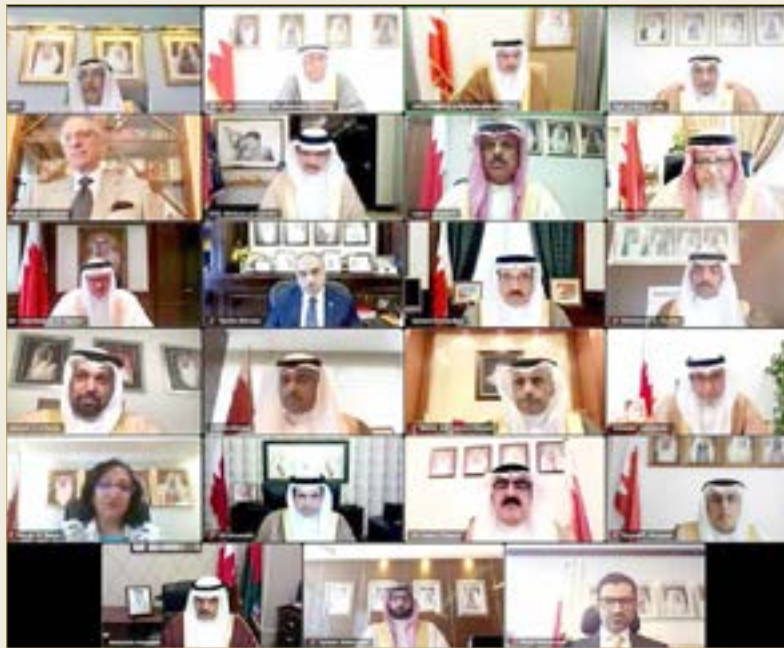
سوم ولي العهد يجلس برئاسة مجلس الوزراء

◆ مجلس الوزراء: كلمة جلالة الملك نقلت رسالتنا للعالم أن السلام ضمانة للشعوب