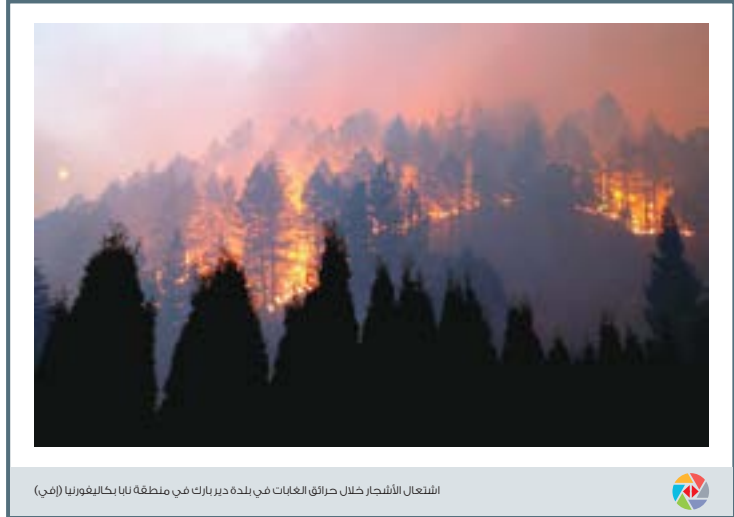
اشتعال الأشجار خلال حرائق الغابات في بلدة دير بارك في منطقة نيا بكاليفورنيا