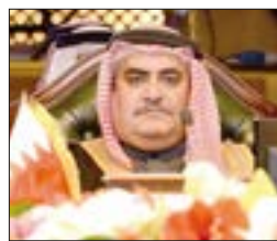
الشيخ خالد بن أحمد آل خليفة

دعا مستشار جلاله الملك للشؤون الدبلوماسية الشيخ خالد بن أحمد آل خليفة، الإثنين، الأمين العام لمجلس التعاون الخليجي الأمين العام لمجلس التعاون الخليجي تايف فلاح الحجرف إلى السعي لوضع حد لما وصفه بـ«الكذب والهذيان»، تعليقا على تصريحات قطر عن «الغزو». وقال الشيخ خالد بن أحمد، في تغريدة عبر حسابه على تويتر: «ألا يتوجب على الأمين العام لمجلس التعاون أن يسعى لوضع حد لهذا الكذب والهذيان المتكرر»، مرفقا خبر CNN بالعربية عن تصريحات وزير الدولة القطري لشؤون الدفاع الشيخ خالد العطية عن خطة غزو قطر. ومن جانبه، قال وزير الدولة للشؤون الخارجية الإماراتي أنور قرقاش أن «هذيان الأخ العطية لا يستحق الرد»، وكان العطية قد صرح بأنه كانت هناك خطة لسرغزو، قطر من قبل ما وصفها بـ«دول الحصار»، في إشارة إلى الدول التي أعلنت مقاطعتها للدوحة والمتعلقة بكل من المملكة العربية السعودية والإمارات والبحرين ومصر، مضيفاً أن «التخطيط بني على مرحلتين: الحصار والضغط على الشعب على اعتبار أنه قد يكون هناك تأثير مباشر على الشارع القطري، ومن ثم الغزو العسكري».