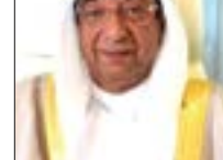
رئيس غرفة التجارة

الجلالة عامل البلاد المجدى حفظه الله وراعاه، بتخفيف انعكاسات جائحة فيروس كورونا على المواطنين والاقتصاد الوطني، وأشاد بقرار مجلس الوزراء السابق بتكفل الحكومة