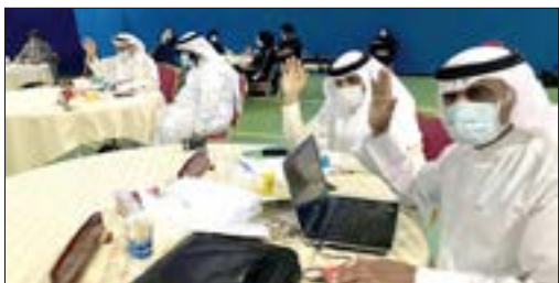
جلسة بلدي الشمالية

البيوت المهجورة بمدينة حمد تشكل ضراً على الأهالي في الأحياء السكنية وأصبحت وعراً لبعض الممارسات غير الأخلاقية تتطلب سرعة التدخل لمعالجتها.