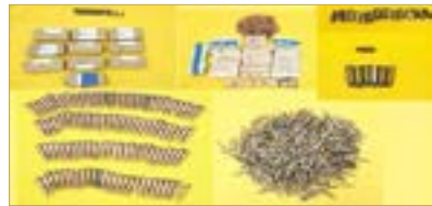
كمية من الأسلحة والمتفجرات المصنوعة مع الخلية الإرهابية

أشادت وزارة الخارجية بكفاءة وبقية رئاسة أمن الدولة بالملكة العربية السعودية الشقيقة، والتي تمكنت من الإطاحة بخلية إرهابية تلقى عناصرها تدريبات عسكرية وميدانية داخل مواقع الحرس الثوري في إيران تضمنت طرق وأساليب صناعة المتفجرات، وضبط كمية كبيرة من الأسلحة والمتفجرات مخبأة في منزل سكني ومزرعة، مؤكدة وقوف مملكة البحرين في صف واحد مع المملكة العربية السعودية ضد كل من يحاول النيل من أمنها واستقرارها، وتضامنها المطلق معها في كل ما تتخذه من إجراءات للدفاع عن مصالحها والحفاظ على سلامة مواطنيها والمقيمين فيها.