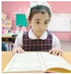
أخرى في معرض فن الطفل؛ لأنها تمتلك مهارة التعبير بالرسم والتلوين».

به من قبل الجميع، وخاصة الكبار التربوي المهمل للتعامل مع فئة اضطراب التوحد في صف الدمج، من خلال ما قدمه لها من برامج أكاديمية وسلوكية متخصصة، حيث تحسنت قدراتها بشكل ملموس، سواء على الصعيد الأكاديمي، حيث نالت التفوق، أو السلوكي بعد أن كان لديها نشاط زائد في الحركة، حتى تم مجيها مع قريباتها من الطالبات في الصفوف العادية.