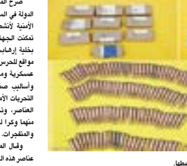
○ أسلحة ومتفجرات تم ضبطها.

ثلاثة منهم تلقوا التدريبات في إيران، أما البقية فقد ارتبطوا مع الخلية بأدوار مختلفة، وصلححة التحقيق تقتضي عدم الكشف عن هويات المقبوض عليهم في الوقت الراهن. كما تم ضبط كمية من الأسلحة والمتفجرات مخبأة في موقعين، أحدهما منزل والأخر عبارة عن مزرعة، وبإشراف الجهات المختصة تحقيقها مع جميع المقبوض عليهم للتوقوف على مزيد من المعلومات عن نشاطهم والأشخاص المرتبطين بهم داخلها وخارجها، واحتفظت السلطات بالتحقيقات إجراءاتها إلى القضاء.