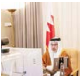
○ سمو ولي العهد خلال ترؤسه جلسة مجلس الوزراء عن بعد. القانون بتعديل بعض أحكام قانون التعليم العالي الذي يهدف إلى فصل اللجنة الرقابية للقطاع عن اللجنة التنفيذية من خلال إعادة هيكلة مجلس التعليم العالي ومخحه استقلالية عن وزارة التربية والتعليم، وسيتم مشروع القانون في تحول دور مجلس التعليم العالي من مشغل إلى مرافق عبر

التوسع بهيئة من حيث الإشراف والرقابة على قطاع التعليم العالي بجانبه التطبيقي والأكاديمي، وتطوير سياسات واستراتيجيات القطاع لتمكين مؤسسات التعليم العالي من تحسين أدائها والتشجيع على الاستثمار فيها، وغيرها من التدابير الباقية إلى المضي قدماً في مشروع تطوير التعليم والتدريب بما يواكب التغيرات المتسارعة في قطاع التعليم وتحسين أداء مؤسسات قطاع التعليم العالي في المملكة. من جهة ثانية بناءً على التقرير الذي تم إعداده بإسناد من صاحب السمو الملكي الأمير خليفة بن سلمان آل خليفة رئيس الوزراء من اللجنة التي وجه سموه إلى تشكيلها لمرحلة القوانين والأنظمة والإجراءات بما يكفل تشديد الرقابة على عمليات صرف الأدوية في الصيدليات الحكومية والخاصة فقد كلف سمو ولي العهد لجنة برئاسة وزير المالية والاقتصاد الوطني لتولي متابعة تنفيذ التوصيات الفنية والإدارية وتشريعها والتأكد من اتخاذ الإجراءات الفورية المتعلقة بالمخاضة بالخاصة والموعة وجميع التشريعات والتشريعات والتوجيه والبيع ومراجعة الأدوية وخاصة المخدرة ومراجعة القوانين والأنظمة ذات العلاقة. ووافق مجلس الوزراء على إعادة تنظيم وزارة الداخلية بحيث يصبح المركز الوطني للأمن السبيرياني ضمن الهيكل التنظيمي لوزارة الداخلية ويصبح وزير الداخلية والقطاع البحري والقطاع الأجنبي يهدف إلى فصل اللجنة الرقابية للقطاع عن اللجنة التنفيذية من خلال إعادة هيكلة مجلس التعليم العالي ومخحه استقلالية عن وزارة التربية والتعليم، وسيتم مشروع القانون في تحول دور مجلس التعليم العالي من مشغل إلى مرافق عبر